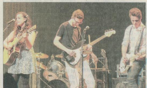
Le groupe Naughty Raccoons n°1 a chauffé la salle à chaque représentation !