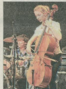
La musique classique n'a pas été oubliée lors de ce spectacle.