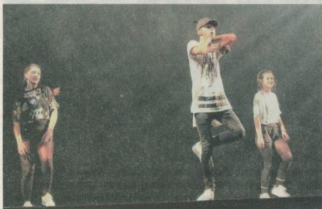
Les styles de danses ont suivi sans jamais se ressembler !