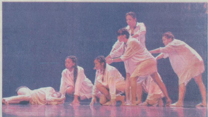
Les jeunes ont très bien représenté le rejet en dansant.