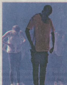
Un autre tableau magnifique autour du thème de la soirée.